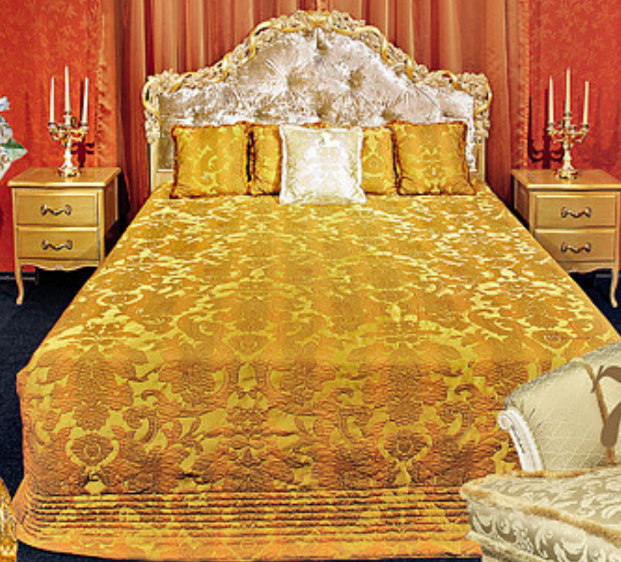
1 Спальная комната S. Fitino , массив, ручная резьба, старинная отделка золотой фольгой (Италия); от 200 000 руб.