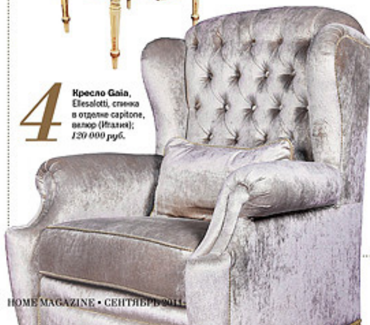
4 Кресло Gala , Elesolotti , спинка в отделке carbone , велюр (Италия); 120 000 руб.