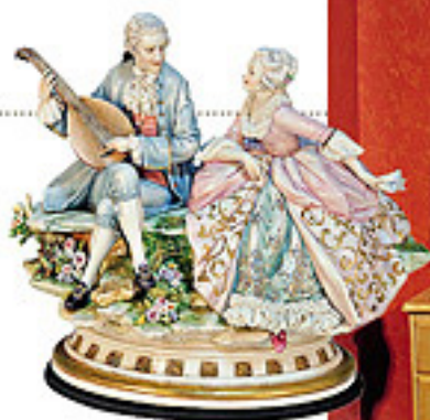
2 Статуэтка Principe , выполненная вручную в лучших традициях школы Сардинского (Италия); 65 000 руб.