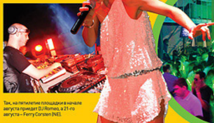
Так, на летней площадке в начале августа придет DJ Romeo, а 21-го августа - Ferry Corsten (NE).

В совершенно ином ритме живет Villa Embargo по вечерам. Днем - анимационные программы, ночью - масштабные вечеринки с приглашенными звездами.