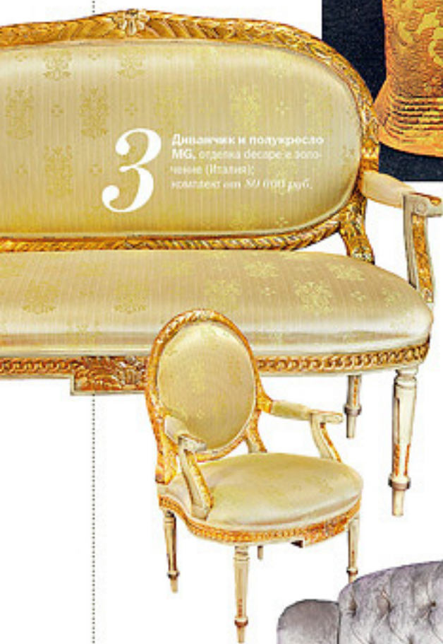
3 Диванчик и полужесткое кресло MG , отделка декором из золоченой (Италия); комплект от 90 000 руб.