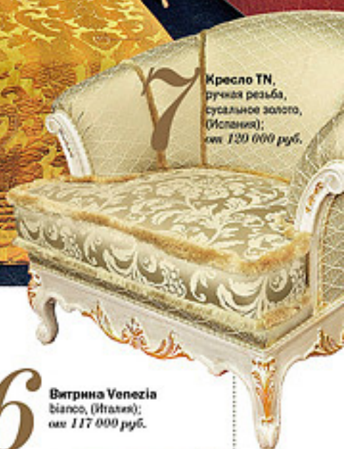
Кресло TN , ручная резьба, сусальное золото, (Испания); от 120 000 руб.